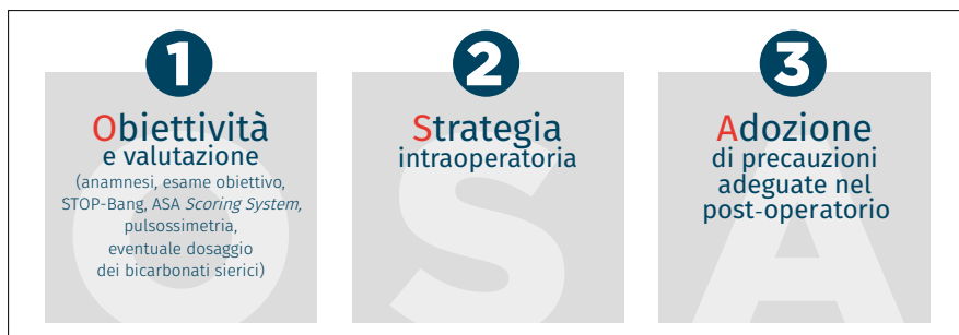
Fig. 1 - Protocollo operativo specifico per pazienti affetti da OSA (documento SIAARTI OSA 2019).

L'elevata prevalenza della patologia e la significativa possibilità di OSA misconosciuta impongono, anche nel non obeso, uno screening mirato che